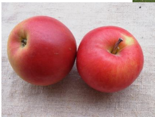
Koks Pūrē uz sējeņu potcelma