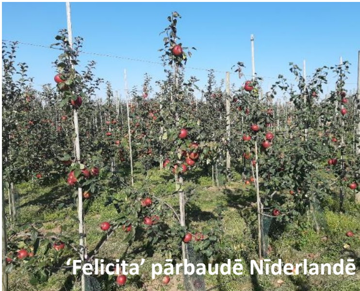
'Felicità' pārbaudē Nīderlandē