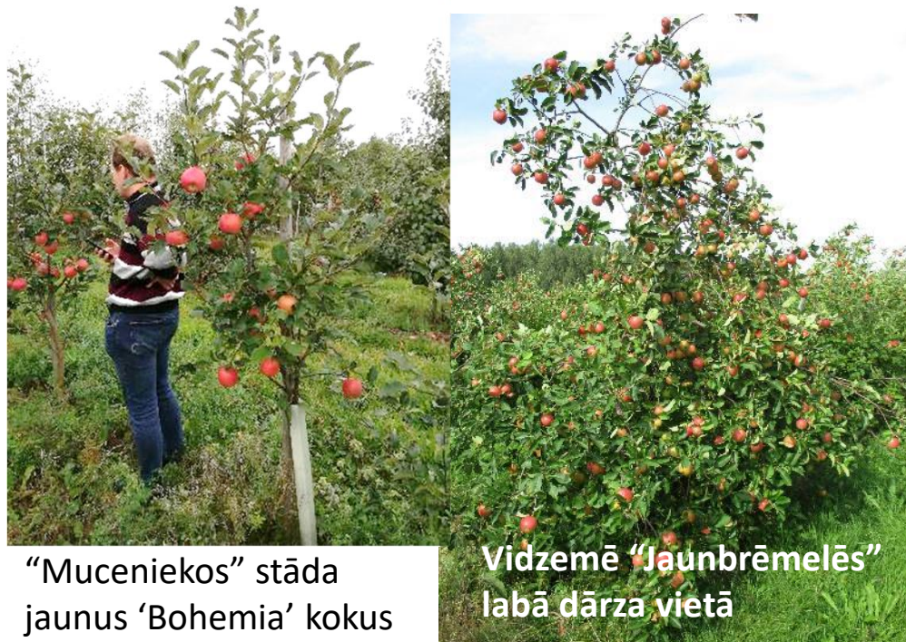
“Muceniekos” stāda jaunus ‘Bohemia’ kokus un pārpotē citas šķirnes