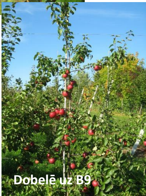
Dobelē uz B9