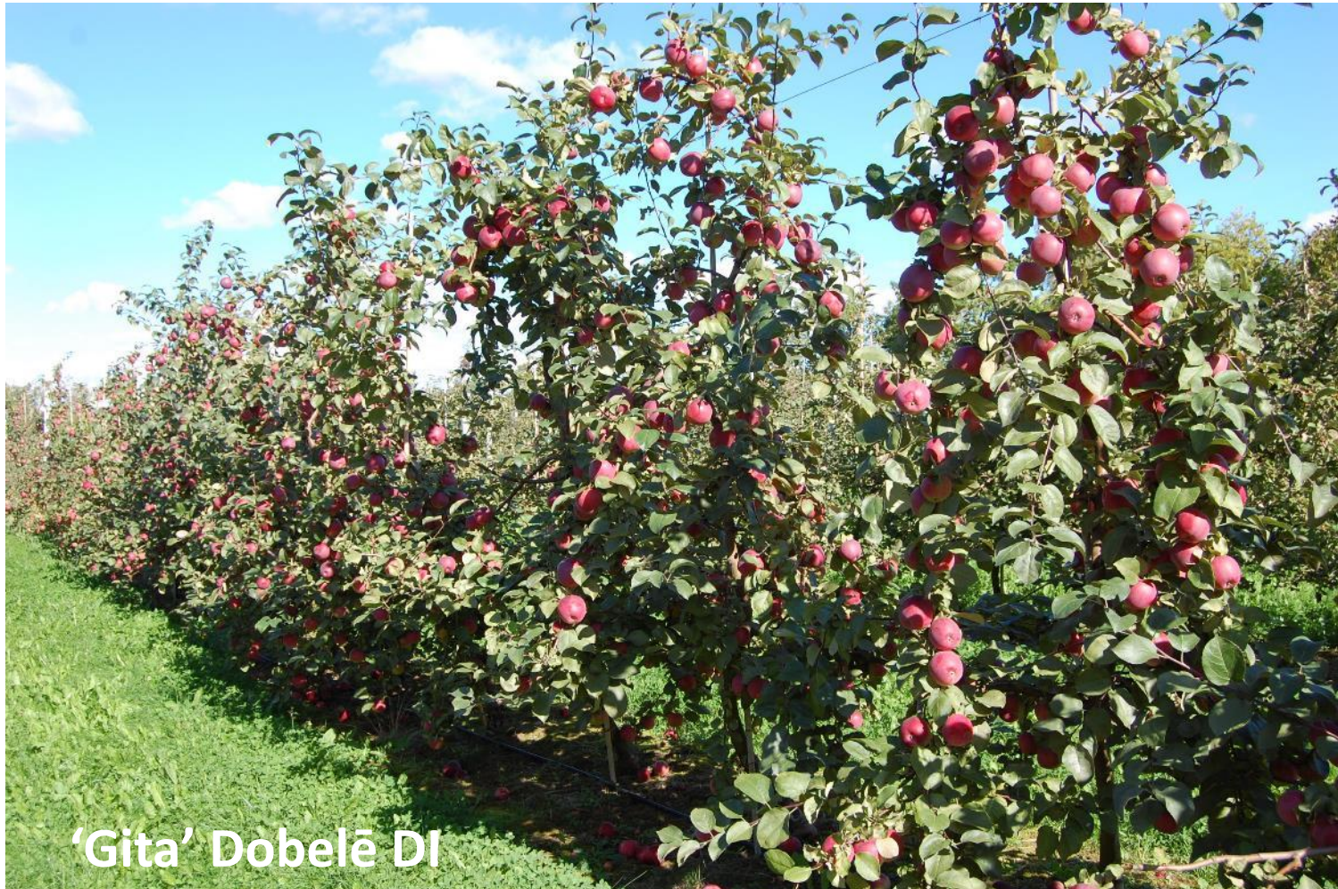
'Gita' Dobelē DI