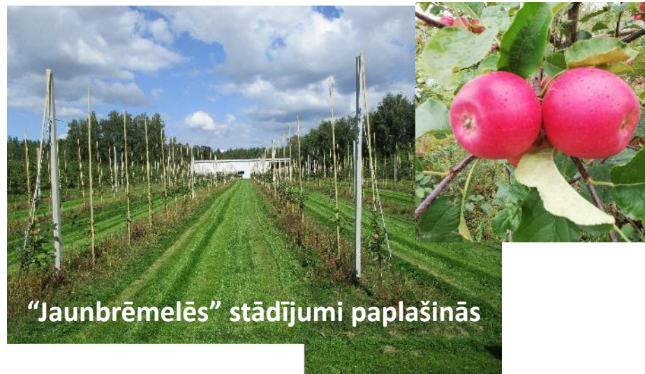
“Jaunbrēmēlēs” stādījumi paplašinās