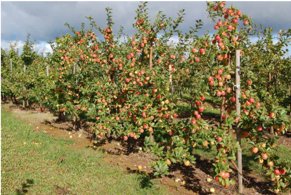
'Zarja Alatau' 2009