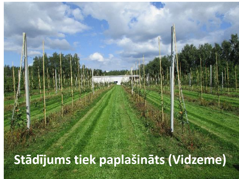
Stādījums tiek paplašināts (Vidzeme)