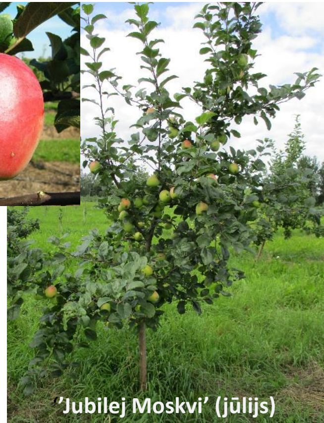
'Jubilej Moskvi' (jūlijs)