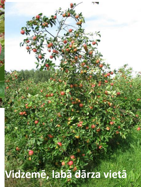
Vidzemē, labā dārza vietā