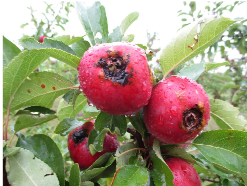
Stiprs aprūsinājums sprēgā, augļi pūst ('Kovaļenkovskoje' z/s Zemgalē)