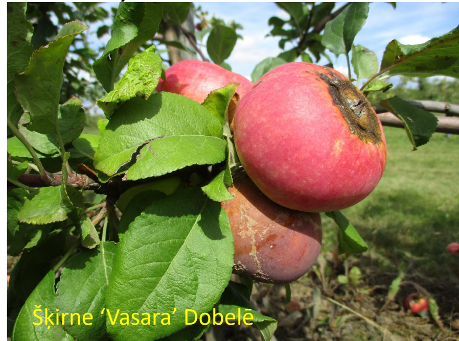
Šķirne 'Vasara' Dobeļē