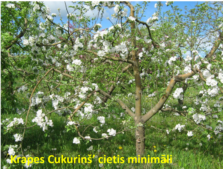
Krapes Cukurinš' cietis minimāli