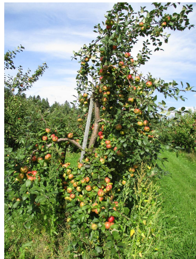
‘Koričnoje Novoje’ raža Valmieras novadā