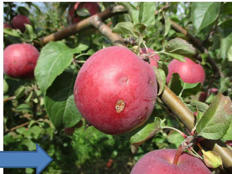
Šķirne 'Roberts' Dobelē