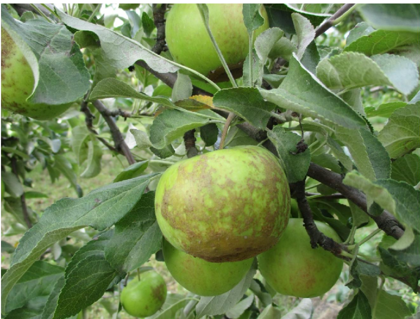
Augļu miza rūsināta ('Radogostj')