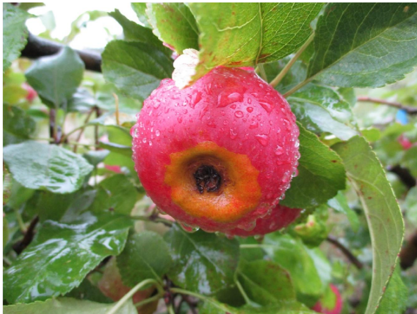
Aprūsinājums pie kausa ('Auksis')