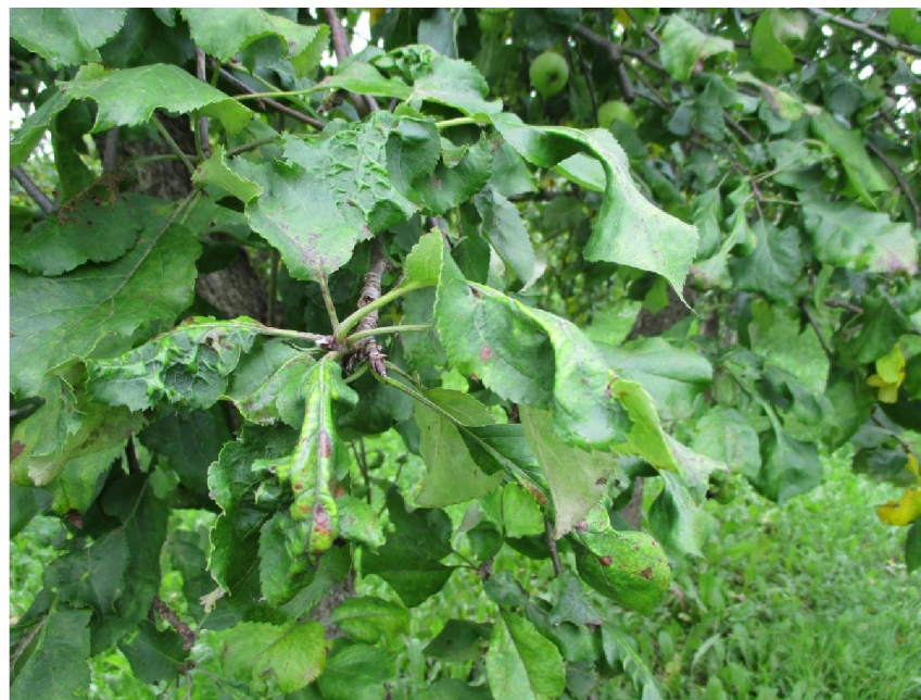
Apsalušas lapas ('Sinap Orlovskij')